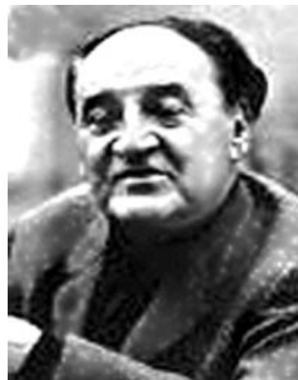
Víctor R. Haya de la Torre

APRA. (Alianza Popular Revolucionaria Americana). Se fundó en 1924 como un "gran frente único antiimperialista". Su jefe, Víctor Raúl Haya de La Torre, la definió como el "Partido revolucionario internacional antiimperialista". Pretextando el atraso de los países del Continente se estructuró, a semejanza del Kuomintang chino, no como partido clasista, sino como un frente único de las cuatro clases. En los años treinta tuvo mucha influencia sobre el movimiento socialista boliviano. Algunos grupos se declararon francamente apristas. En 1935, el Partido Comunista peruano propuso al APRA constituir el frente popular y la respuesta fue que la organización timoneada por Haya de la Torre era ya eso. Su planteamiento: la emancipación nacional del yugo imperialista y la unificación económica y política indoamericana. La revolución proletaria vendrá después. El imperialismo es la última etapa del capitalismo en los pueblos industriales, pero representa en los nuestros la primera etapa. Nuestro capitalismo nace con el advenimiento del imperialismo. Nace, pues, dependiente, y como resultado de la culminación del imperialismo en Europa y en los Estados Unidos". Durante la segunda guerra mundial se alineó junto a Norte América. Concluye como francamente pro-imperialista. No oculta sus simpatías hacia el MNR. En las elecciones peruanas de 1985 alcanzó la victoria.