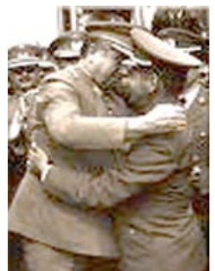
Pinochet y Banzer

ABRAZO DE CHARAÑA. El 8 de febrero de 1975 tuvo lugar, a invitación del general Pinochet, el encuentro de los presidentes de Bolivia y Chile. Las relaciones diplomáticas entre ambos países habían sido interrumpidas en 1962 como consecuencia de entredicho alrededor de la desviación del río Lauca por parte de Chile. Pinochet estaba interesado en romper su aislamiento internacional. Fue suscrita una declaración que, en síntesis, decía: "Ambos mandatarios... han resuelto se continúe el diálogo a diversos niveles, para buscar fórmulas de solución a los asuntos vitales que ambos países confrontan, como el relativo a la situación de mediterraneidad que afecta a Bolivia, dentro de recíprocas conveniencias y atendiendo a las aspiraciones de los pueblos boliviano y chileno". Más tarde Chile ofreció un corredor marítimo al norte de su territorio a cambio de una compensación territorial, La política internacional del gobierno Banzer fue motivo de controversia. El oficialismo lanzó el lema de "Mar a como dé lugar". Se