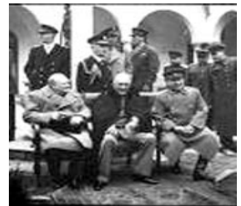
Acuerdo de Yalta

ACUERDO DE YALTA. Se firmó el 11 de febrero de 1945 entre EEUU, Inglaterra y la URSS. Aprobó una declaración sobre la Europa liberada y fueron delineadas las zonas de influencia entre los bloques timoneados por la URSS y por los Estados Unidos de Norte América.