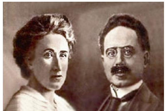
Rosa Luxemburgo y Carlos Liebknecht