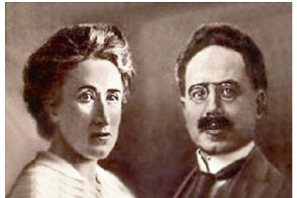
Rosa Luxemburgo y Carlos Liebknecht