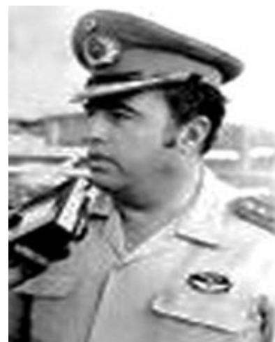
Luis Arce Gómez

ARCE GÓMEZ, LUIS, coronel. Sindicado en el senado norteamericano y por la DEA como una pieza clave del narcotráfico. Por pedido de los comandantes de grandes y pequeñas unidades fue relevado en marzo de 1981 del cargo de Ministro del Interior que venía ejerciendo desde el 17 de julio de 1980. El 30 de marzo fue relevado de su cargo de Comandante del Colegio Militar que ejerció por algunos días y obligado a pedir licencia de las Fuerzas Armadas para responder a las sindicaciones de vinculación con el narcotráfico que adquirieron caracteres de escándalo. Se refugió en la Argentina, donde le alcanzó la justicia norteamericana, que pidió sin éxito, su extradición para ser juzgado en el país del Norte por sus implicaciones con el narcotráfico. Fue uno de los principales organizadores de grupos paramilitares, cuya actividad justificó públicamente. Los negocios ilícitos le proporcionaron una cuantiosa fortuna.