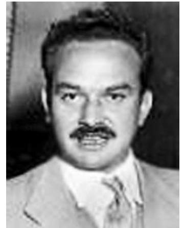
Ñuflo Chávez Ortíz

CHÁVEZ ORTÍZ, ÑUFLO. Nació en Santa Cruz el 3 de octubre de 1923. Militante y dirigente movimientista, tuvo una línea oscilante en extremo: formó parte de la COB como personero de la izquierda del MNR (lechinismo), siguió a Siles y concluyó aliándose con el derechista Paz Estenssoro. Ministro de Asuntos Campesinos durante el primer gobierno de Paz. En 1956 fue elegido vicepresidente, impuesto por la izquierda lechinista, cargo al que renunció en 1957. En las elecciones de 1980 apareció como vicepresidente en la perdedora candidatura de Paz Estenssoro.