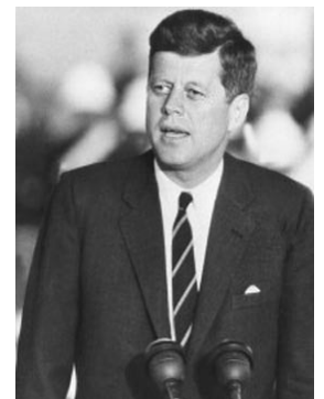
John F. Kennedy