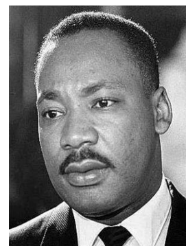
Martín Luther King

KING, MARTÍN LUTHER L. Pastor protestante asesinado el 4 de abril de 1968 en Memphis, Tennessee (EEUU. de N. A). Dirigió la "National association for the advancement of colored people" y estuvo a la cabeza de la gran demostración de 20.000 negros y blancos, reunidos en Washington, en apoyo del "Programa de los derechos cívicos" del presidente Kennedy.