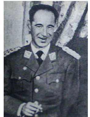
Alfredo Ovando Candia

OVANDO CANDIA, ALFREDO. Nació en Cobija (Pando) el 6 de abril de 1918 y murió en La Paz el 24 de enero de 1982. Concurrió a la guerra del Chaco y formó parte de la célula militar del MNR. En su calidad de Comandante en Jefe de las Fuerzas Armadas fue colaborador y sostén del último gobierno de Víctor Paz, al que traicionó para conspirar subrepticamente con el general Barrientos. Fue copresidente de la Junta Militar de Gobierno (1965). En 1969 derrocó al presidente Luis Adolfo Siles para luego asumir la presidencia. Nacionalizó las pertenencias de la Gulf Oil, desconoció el código del petróleo Davenport, sentó las bases de la fundición de estaño de Vinto y entregó Matilde a una empresa norteamericana.