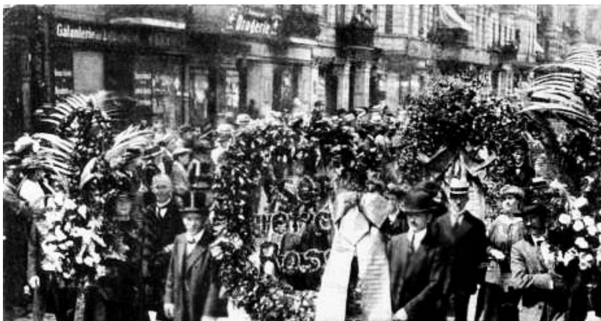
Funeral Rosa Luxemburgo

los obreros que en la fortaleza organizativa del partido revolucionario. La vanguardia política del proletariado alemán no se había convertido aún en el caudillo del país y la revolución empujada por los obreros desorganizados quedó aislada y rápidamente destruida. Este gravísimo error costó la vida de miles de combatientes sacrificados y de la más grande revolucionaria de nuestra época.