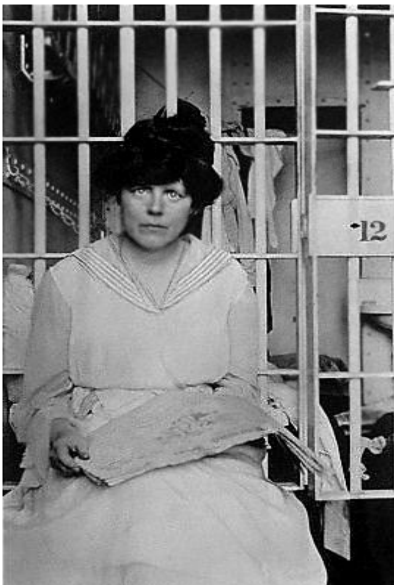
En la cárcel de Wronke 1917

En aquella época Suiza era el centro de encuentro de la emigración rusa y polaca. La universidad ofrecía a los jóvenes revolucionarios la posibilidad de capacitarse políticamente. Los jóvenes y las muchachas, que ya conocían el rigor de la represión zarista y habían pasado por las cárceles y policías, vivían en colonias. Leían y discutían sobre Darwin, sobre la emancipación de la mujer, sobre Marx, Tolstoi, Bakunin, acerca de los métodos de la lucha de clases, sobre Marx, Tolstoi, Bakunin, sobre los métodos de la lucha de clases, sobre la liberación de Polonia, la socialdemocracia alemana, el terrorismo ruso, Turgueniev, Zola..., en fin, sobre el problema de la revolución.