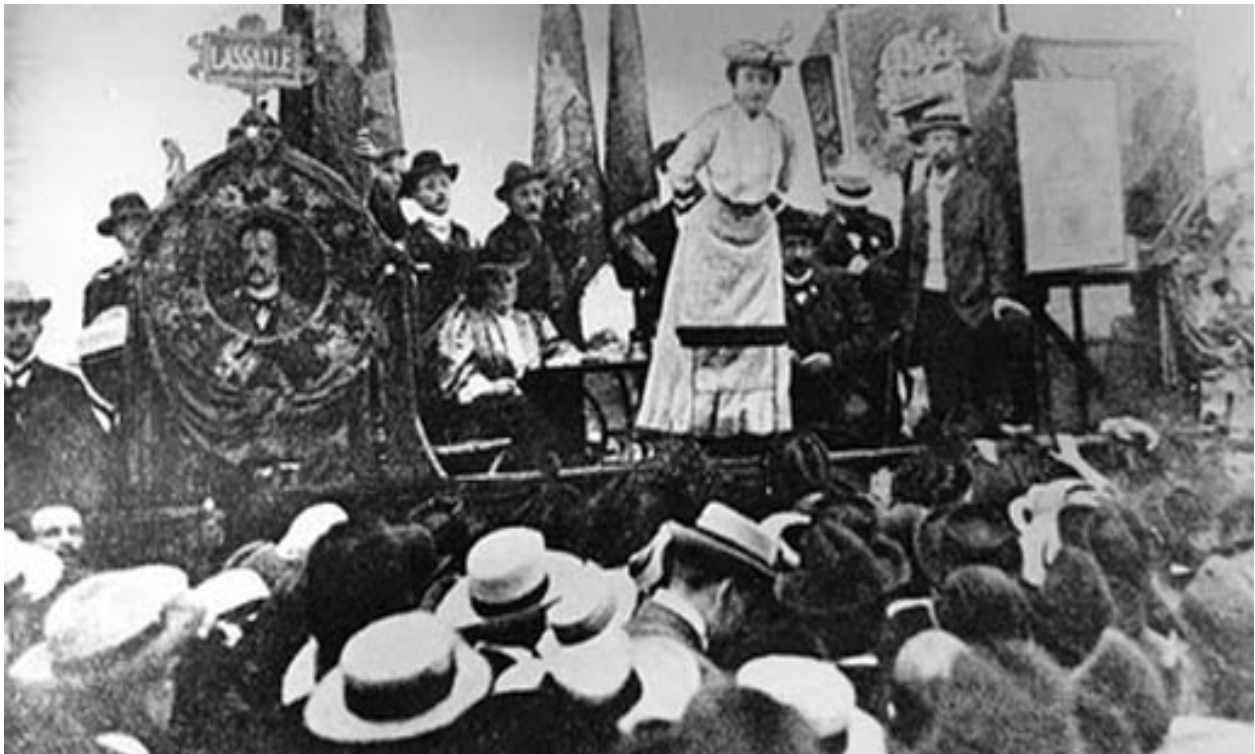
Rosa Luxemburgo en una manifestación

Luego de residir por breve tiempo en Francia, donde se pone en contacto con los líderes del movimiento revolucionario francés (Jules Guesde, Vallaint, Allemane) llega a Alemania en 1897. En aquella época Alemania era el centro del movimiento obrero y de la política mundial.