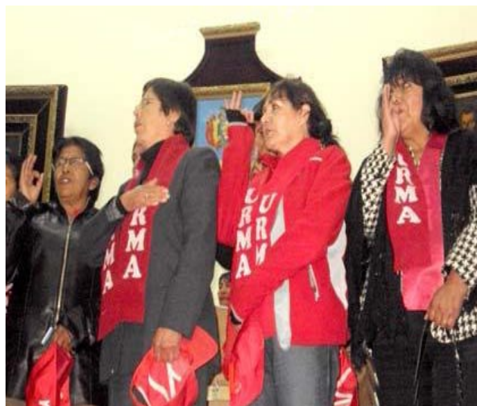
URMA - Oruro

Con la masiva concurrencia de las bases, en ambos distritos, una aplastante mayoría votó por la corriente revolucionaria del magisterio urbano de Bolivia; para ellas, URMA es la única corriente anti oficialista que encarna sus aspiraciones y garantiza una lucha consecuente contra el gobierno derechista y anti docente que está decidido a destruir las conquistas de la educación fiscal y del magisterio en particular.