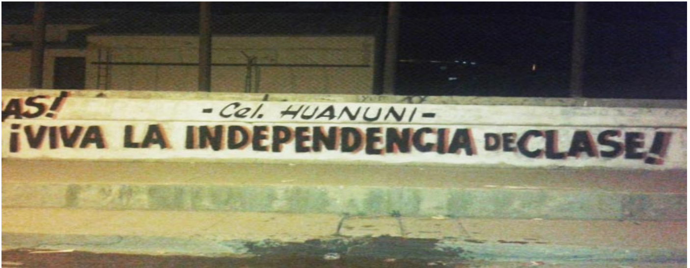
Mural en Huanuni.