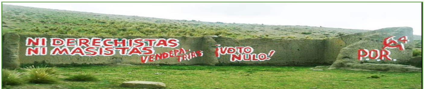
Mural al ingreso de Colquiri