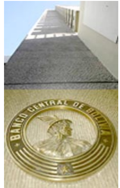
Banco Central de Bolivia