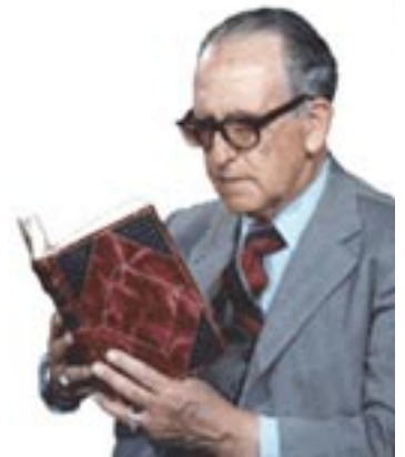
Fernando Diez de Medina

DÍEZ DE MEDINA, FERNANDO. Nació en La Paz el 14. de enero de 1908. Poeta, escritor, ensayista, periodista. Oficialmente no hace política, sino literatura, pero permanentemente aparece enredado en trajines de politiquería y últimamente al servicio de los dictadores militares, particularmente del general Barrientos. Apoyó la candidatura presidencial del cursista Gabriel Gosálvez, poco después se identificó con el MNR, partido del que renegará para criticarlo acerbamente. Presidió la Comisión de Reforma Educacional. Ministro de Educación (1956-57). "En 1928 -dice-, publiqué mi primer libro 'La clara senda-poemas'... Ese mismo año fundé la página literaria de 'El Diario', bajo el rubro de 'Hombres, Ideas, Libros' que dirigí y mantuve durante cuatro años... A partir del citado año... hice mis primeras armas en el periodismo como reportero y redactor de 'El Diario'... Recuerdo haber entrevistado, en sendos reportajes, a las tres personalidades más eminentes de esa época: Montes, Saavedra y Salamanca". Con algunos falangistas fundó el Pachakutismo, que se presentó como furiosamente antipatiñista. Fundó y dirigió las revistas "Cordillera" (1956-57) y "Nova". Estilista remarcable, maneja bien el idioma, pero sus obras tienen poca substancia, si se exceptúan "Tamayo" y "Literatura boliviana".