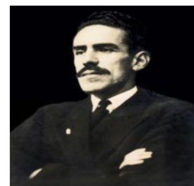
Oscar Únzaga de la Vega

ÚNZAGA DE LA VEGA, OSCAR. Nació en Cochabamba el 19 de abril de 1916 y murió asesinado en La Paz el 19 de abril de 1959. Político falangista, encarnó la historia de FSB como fuerza de choque de la rosca boliviana. Inició estudios de agronomía en Santiago de Chile, que luego abandonó para dedicarse íntegramente a la política. El 15 de agosto de 1937 funda FSB en Chile, juntamente con otros jóvenes. Cristiano, y nacionalista, creía que era su deber destruir al comunismo allí donde se encontrase. En julio de 1940, FSB dispersó el congreso de fundación del PIR en Oruro. Fundador de la Sociedad de Artistas y Escritores de Cochabamba. Hizo periodismo desde "La Prensa", "Reflejos", "La Acción", "Antorcha"; pero, utilizó la arenga y el panfleto para difundir sus ideas reaccionarias. En 1947 llegó al parlamento y en 1956 fue proclamado candidato a la presidencia de la república. Después de 1952 acaudilló una furiosa resistencia a los gobiernos movimientistas, que los consideraba comunistas. Su pensamiento puede sintetizarse en la defensa del ejército y de la iglesia, expresiones de la gran propiedad privada.