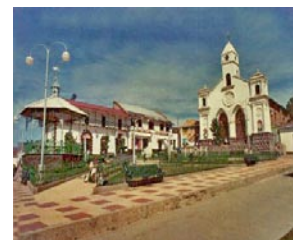
Plaza de Uncía