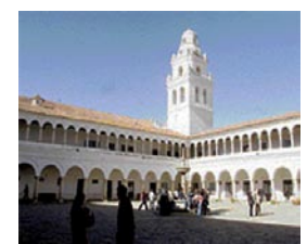
Universidad de Charcas

UNIVERSIDAD DE CHARCAS. Fundada en 1621. La Real Academia Carolina estaba destinada a la práctica forense. Según Arnade: "Fue en este patio de la Academia que las ideas radicales comenzaron a desarrollarse durante estas polémicas privadas... dentro de sus salas fueron plantadas las semillas que trajeron la ruina del imperio español en todo el Sud de la América Meridional (La inteligencia de Charcas tuvo en "el silogismo su más útil herramienta... Aquino, Suárez, Maquiavelo y el silogismo, fueron cuatro elementos fundamentales en el movimiento de independencia de Charcas. ¿Podría ser realizada la separación frente a España?"). Los historiadores no señalan qué contradicciones de la estructura económica interpretaban las evoluciones de la ideología.