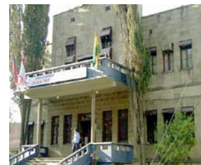
Universidad J. M. Saracho

UNIVERSIDAD JUAN MISAEL SARACHO. Decreto de 13 de mayo de 1927: "En homenaje al doctor Juan Misael Saracho, organizador y renovador de la instrucción pública en el país, designase a la Universidad de Tarija, con el nombre de "Juan Misael Saracho".